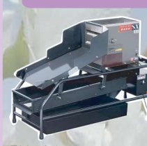
FX-G1型 製造終了から15年