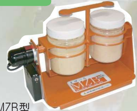
MZB型 製造終了から13年