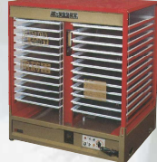
M-500ET型 製造終了から24年