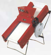
KBS-5型 製造終了から35年

KB-1、KB-II、KBS-I、KBS-II、KBS-III、KBS-5、KBS-6H、KB-3M