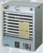
M-100E型 製造終了から17年