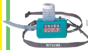
SK-3型 製造終了から26年

SK-1、SK-2、SK-3、SK-4、 SK-5、SK-5L、SK-5SL、SK-5F