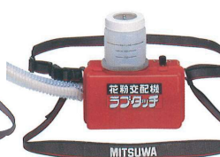
SK-4型 製造終了から23年