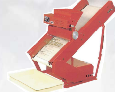
KB-3M型 製造終了から10年