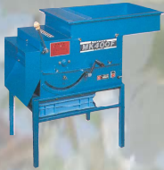
MK-400F型 製造終了から26年

POPP-A、POPP・S、POPP-DX MK-400F、MK-オート800、POPP-DX2