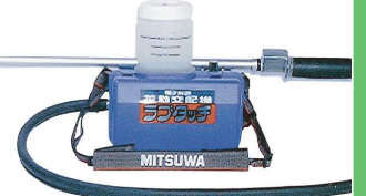
SK-5型 製造終了から9年