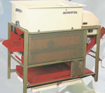
MK-オート800 製造終了から29年