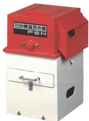
PSM型 製造終了から29年