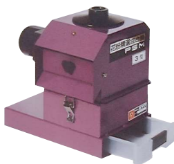
PSM-3型 製造終了から12年