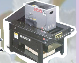
FX-G4型 製造終了から11年