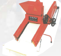
KBS-6H型 製造終了から16年