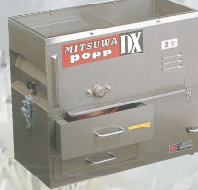
POPP-DX2型 製造終了から16年